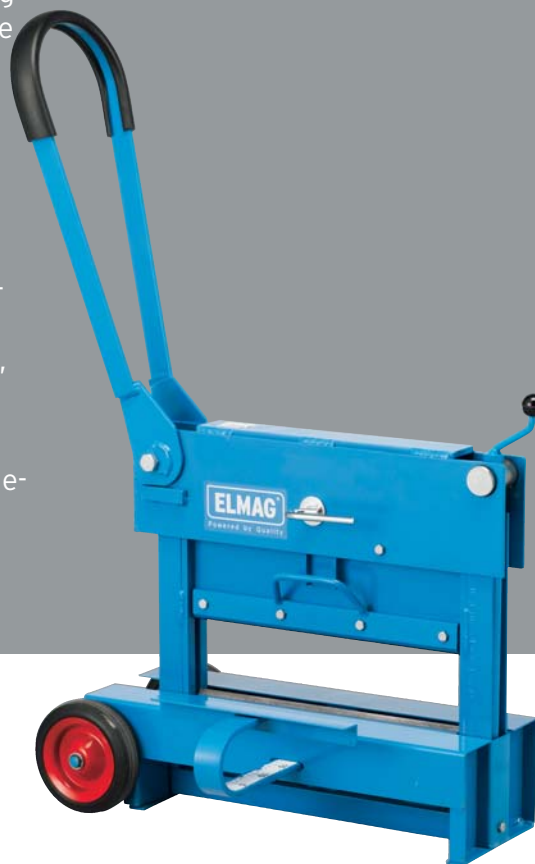
SK 420 - Trennstellung

Mit einer Grob- und einer Millimetereinstellung mit Drehspindel kommt der SK 420 einer raschen Arbeitsweise entgegen.