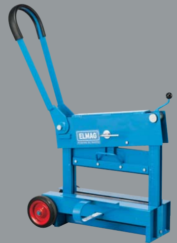
SK 420 - Grundstellung

SK 420 - ein unentbehrliches, praktisches Gerät für jeden Verlegeprofi und Steinmaurer.