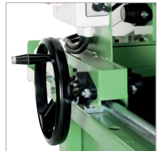
Handstellrad für präzisen Schlittenvorschub

Inklusive segmentierte Diamantscheibe für universellen Einsatz