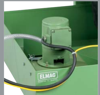
Starke Wasserpumpe für ausreichend Kühlwasser