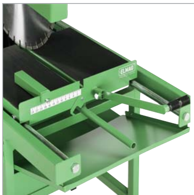
Queranschlag mit Messskala, Handhebel für komfortable Bewegung des Horizontalschlittens

Die ZSM 880/650 überzeugt durch ihre einfache, praxisorientierte Technik und deckt mit einer Schnittleistung von maximal 250 x 880 mm die meisten Anforderungen an eine moderne Ziegelschneidmaschine ab.