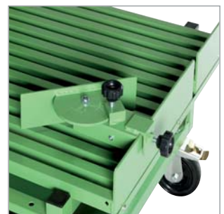
Verstellbarer Anschlag- winkel für Schrägschnitte, Feststellbremse an zwei Transportrollen