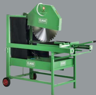
ZSM 880/650 Abgesenkter Schneidkopf mit Rollschlitten in Schneidstellung