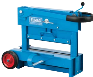
SK 420 - Transportstellung

Mit einer Grob- und einer Millimetereinstellung mit Drehspindel kommt der SK 420 einer raschen Arbeitsweise entgegen.