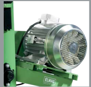
Antriebsmotor 400 V für Keilriemenantrieb

ZSM 1050/900 mit tief gelegtem Schneidetisch, ideal für schwere Werkstücke und tiefe Schnitte