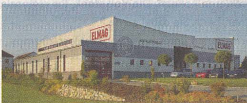
ELMAG-Firmenzentrale in Ried im Innkreis/OÖ.