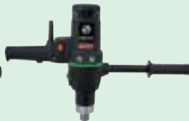
EHB 32/2.2 R